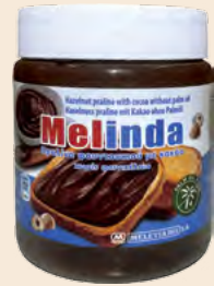
Βάζο Πλαστικό / Plastic Vase Πραλίνα χωρίς φοινικέλαιο Praline without palm oil