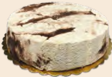
Σαλονικιός Βανίλια με κουβερτούρα Extra Salonikios Vanilla with couverture Extra Ταψί / Pan