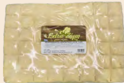
Χωριάτικη Ορθογώνια Πίτα Συσκευασμένη / Traditional Pie Rectangular Packed