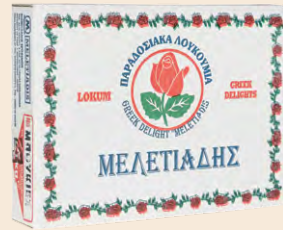
Ινδοκάρυδο / Coconut Διάφορες Γεύσεις / Mix Flavours Κουτί / Box