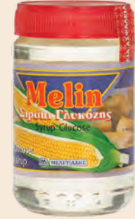
Σιρόπι γλυκόζης / Glucose sirup Γυάλινο Βάζο MELIN / Glass Jar MELIN