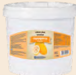
Κουβάς / Bucket Περγαμόντο / Bergamot