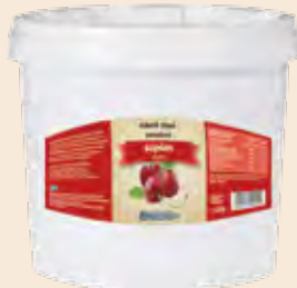
Κουβάς / Bucket Κεράσι / Cherry