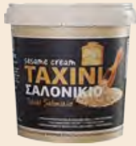
Ταχίνι / Sesame Cream Κουβαδάκι / Bucket