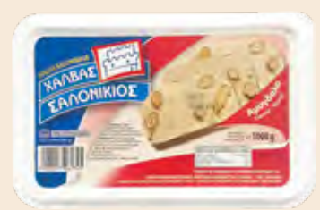
Σαλονικιός Αμύγδαλο / Salonikios Almond

Ορθογώνιο Τάπερ Πλαστικό / Rectangle Plastic Pot