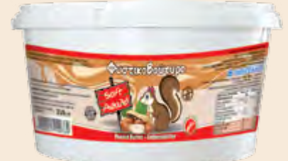
Φυστικοβούτυρο / Peanut Butter Κουβάς / Bucket