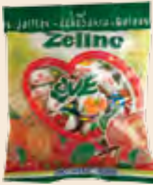
Zelino ζελεδάκια ασορτί / Zelino jellies mixed