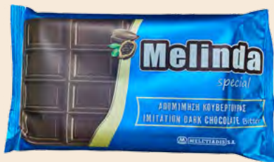
Απομίμηση Κουβερτούρας Νο333 Imitation of Couverture No333