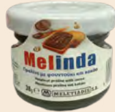
Μερίδα Γυάλινο Βάζο / Portion Glass Jar