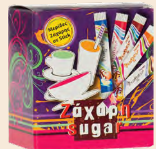
Ζάχαρη - Καστανή Ζάχαρη / Sugar - Brown Sugar Μεριδες 1000τμχ / Sticks 1000pcs