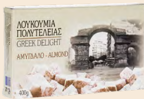
Αμύγδαλο / Almond Κουτί / Box