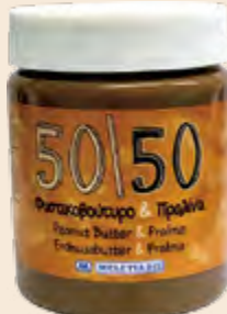
Φυστικοβούτυρο & Πραλίνα / Peanut Butter & Praline Βάζο Πλαστικό / Plastic Vase