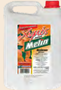
Συμπυκνωμένος Χυμός / Adiluted Juice Βερίκοκο / Apricot