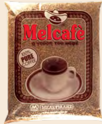
Καφές Ελληνικός Σπυρί Πεφρυγ. MELCAFE / Greek Coffee Beans Roasted MELCAFE