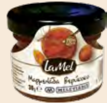
Μερίδα Γυάλινο Βάζο LA MEL / Portion Glass Jar LA MEL Φράουλα, Κεράσι, Βερούκο, Ροδάκινο, Πορτοκάλι, Βατόμουρο Strawberry, Cherry, Apricot, Peach, Orange, Raspberry