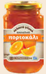
Γυάλινο Βάζο / Glass Jar Πορτοκάλι / Orange