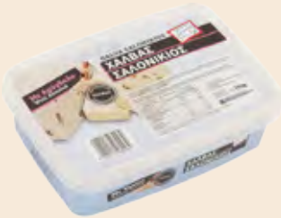
Σαλονικιός Αμύγδαλο / Salonikios Almond

Ορθογώνιο Τάπερ Πλαστικό / Rectangle Plastic Pot