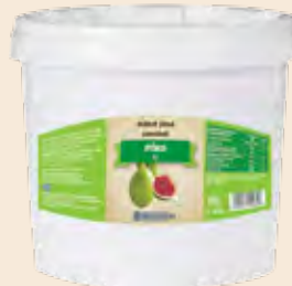
Κουβάς / Bucket Σύκο / Fig