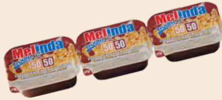
Μεριδα / Portion