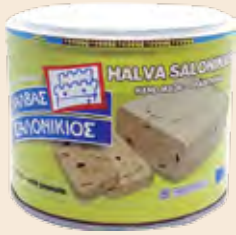
Σαλονικιός Φυστίκι / Salonikios Peanuts Μεταλλικό Κουτί / Metallic Box