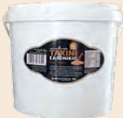
Ταχίνι / Sesame Cream Κουβάς / Bucket