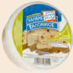
Σαλονικιός Φυστίκι / Salonikios Peanuts

Στρογγυλό Τάπερ Πλαστικό / Round Plastic Pot