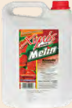
Συμπυκνωμένος Χυμός / Adiluted Juice Φράουλα / Strawberry