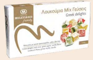
Διάφορες Γεύσεις / Mix Flavours Κουτί / Box