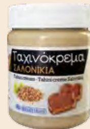
Ταχινόκρεμα / Tahini Cream Βάζο Πλαστικό / Plastic Vase