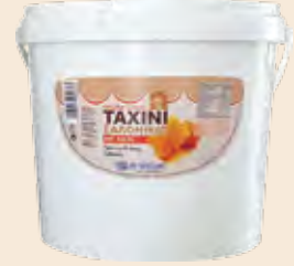
Ταχίνι με Μέλι / Sesame Cream with Honey Κουβάς / Bucket