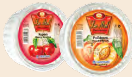
Τάπερ Πλαστικό LA MEL / Plastic Pot LA MEL Φράουλα, Κεράσι, Βερούκο, Ροδάκινο Strawberry, Cherry, Apricot, Peach