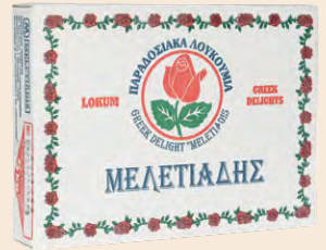
Βανίλια / Vanilla Τριαντάφυλλο / Rose Μαστίχα Χίου / Chios Mastic Αμύγδαλο / Almond Κουτί / Box