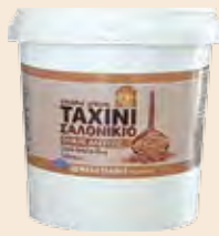
Ταχίνι Ολικής Αλέσεως / Sesame Cream Wholegrain Κουβαδάκι / Bucket