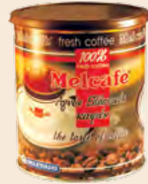
Καφές Ελληνικός Μεταλλικό Κουτί MELCAFE / Greek Coffee Metal Tin MELCAFE