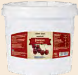
Κουβάς / Bucket Βύσσινο / Sour cherry