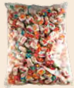
Zelino ζελεδάκια ασορτί mini / Zelino jellies mixed mini