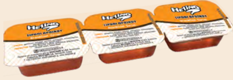
Σιρόπι με άρωμα μέλι / Sirup with honey flavour Μεριδά HELINO / Portion HELINO