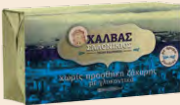
Σαλονικιός Βανίλια χωρίς ζάχαρη / Salonikios Vanilla no sugar Κουτί / Box