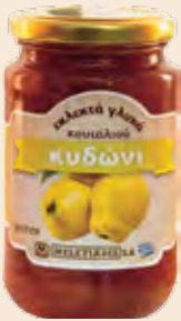
Γυάλινο Βάζο / Glass Jar Κυδώνι / Quince