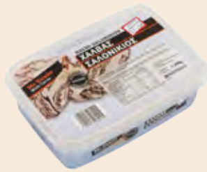
Σαλονικιός Κακάο / Salonikios Cocoa

Ορθογώνιο Τάπερ Πλαστικό / Rectangle Plastic Pot