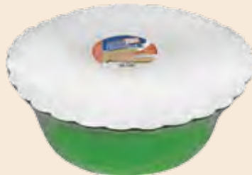
Σαλονικιός Βανίλια / Salonikios Vanilla Λεκάνη / Bowl