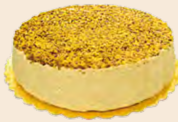
Σαλονικιός Φυστίκι Κελυφωτό Extra Salonikios Pistachio Extra Ταψί / Pan