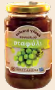
Γυάλινο Βάζο / Glass Jar Σταφύλι / Grape