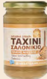
Ταχίνι Ολικής Αλέσεως / Sesame Cream Wholegrain Γυάλινο Βάζο / Glass Jar