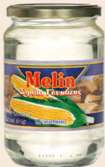
Σιρόπι γλυκόζης / Glucose sirup Γυάλινο Βάζο MELIN / Glass Jar MELIN