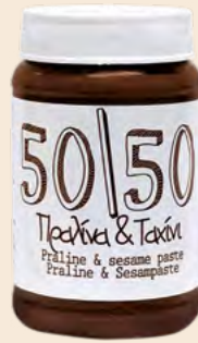
Γυάλινο Βάζο / Glass Jar