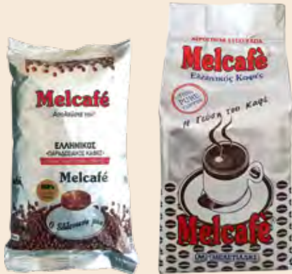
Καφές Ελληνικός Αλεσμένος MELCAFE / Greek Coffee MELCAFE