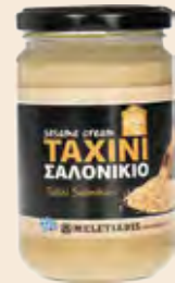
Ταχίνι / Sesame Cream Γυάλινο Βάζο / Glass Jar