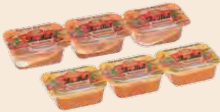
Μερίδα LA MEL / Portion LA MEL Βερούκο, Φράουλα, Ροδάκινο, Κεράσι, Πορτοκάλι Apricot, Strawberry, Peach, Cherry, Orange