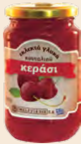
Γυάλινο Βάζο / Glass Jar Κεράσι / Cherry