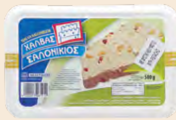
Σαλονικιός Φυστίκι / Salonikios Peanuts

Ορθογώνιο Τάπερ Πλαστικό / Rectangle Plastic Pot