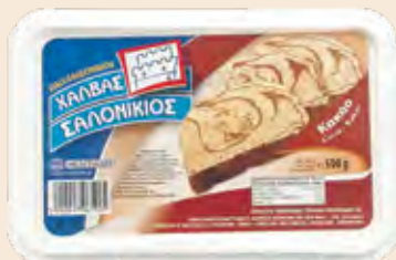
Σαλονικιός Κακάο / Salonikios Cocoa

Ορθογώνιο Τάπερ Πλαστικό / Rectangle Plastic Pot