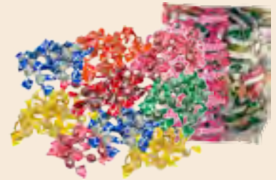
Clipper μπίλια ασορτί / Clipper candies mixed Ούζο, Μέντα, Φράουλα, Λεμόνι, Βύσσινο, Πορτοκάλι Ouzo, Mint, Strawberry, Lemon, Sour cherry, Orange