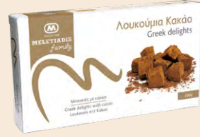
Κακάο / Cocoa Κουτί / Box