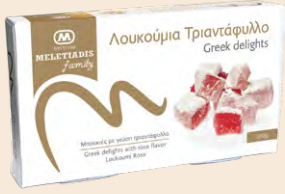
Τριαντάφυλλο / Rose Κουτί / Box