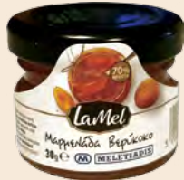
Μερίδα Γυάλινο Βάζο LA MEL / Portion Glass Jar LA MEL Φράουλα, Κεράσι, Βερύκοκο, Ροδάκινο, Πορτοκάλι, Βατόμουρο Strawberry, Cherry, Apricot, Peach, Orange, Raspberry