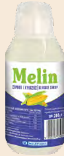
Σιρόπι γλυκόζης / Glucose sirup Μπουκάλι Squeeze MELIN / Squeeze Bottle MELIN