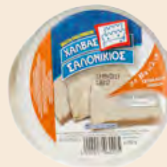
Σαλονικιός Βανίλια / Salonikios Vanilla Στρογγυλλό Τάπερ Πλαστικό / Round Plastic Pot