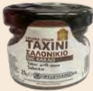
Ταχίνι με Κακάο / Sesame Cream with Cocoa Μερίδα Γυάλινο Βάζο / Portion Glass Jar