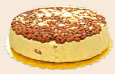
Σαλονικιός Αμύγδαλο Extra Salonikios Almond Extra Ταψί / Pan