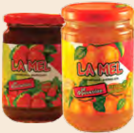
Φρουκτόζη LA MEL / Fructose LA MEL Φράουλα, Βερούκο / Strawberry, Apricot