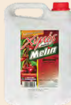
Συμπυκνωμένος Χυμός / Adiluted Juice Βύσσινο / Sour cherry