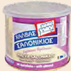
Σαλονικιός Αμύγδαλο / Salonikios Almond Μεταλλικό Κουτί / Metallic Box