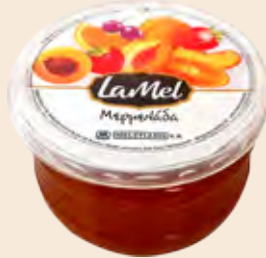
Βάζο Πλαστικό LA MEL / Plastic Vase LA MEL Φράουλα, Κεράσι, Βερούκο, Ροδάκινο, Πορτοκάλι Strawberry, Cherry, Apricot, Peach, Orange