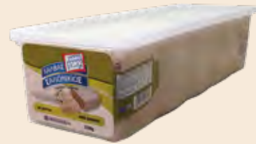
Σαλονικιός Αμύγδαλο / Salonikios Almond Φόρμα πλαστική / Plastic Form