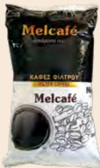
Καφές Φίλτρου Αλεσμένος MELCAFE / Filter Coffee MELCAFE