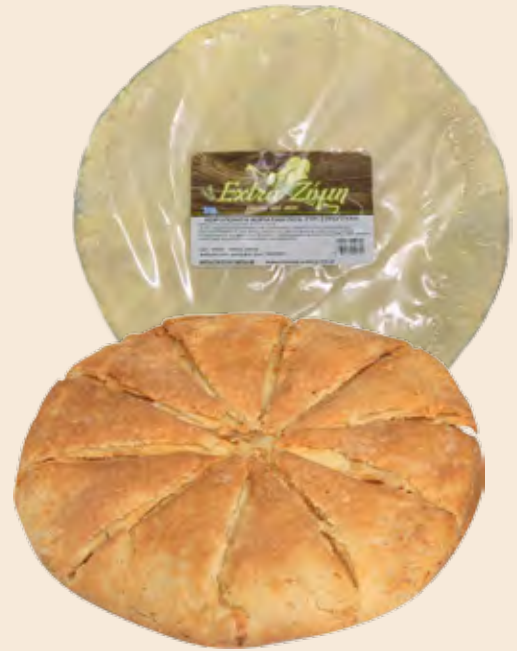
Χωριάτικη Στρογγύλη Πίτα Συσκευασμένη / Traditional Pie Round Packed