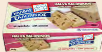
Λονικιός Αμύγδαλο / Salonikios Almond Κουτί / Box