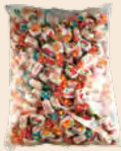
Zelino ζελεδάκια ασορτί / Zelino jellies mixed