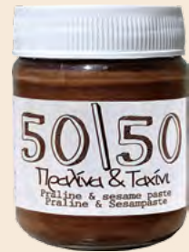
Γυάλινο Βάζο / Glass Jar