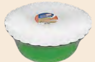
Σαλονικιός Βανίλια χωρίς ζάχαρη / Salonikios Vanilla no sugar Λεκάνη / Bowl