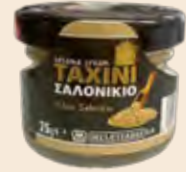
Ταχίνι / Sesame Cream Μερίδα Γυάλινο Βάζο / Portion Glass Jar