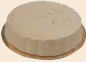
Σαλονικιός Ολικής Αλέσεως / Salonikios Wholegrain Ταψί / Pan