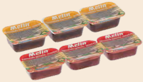
Μερίδα MELIN / Portion MELIN Φράουλα, Κεράσι, Ροδάκινο, Βερύκοκο, Πορτοκάλι Strawberry, Cherry, Peach, Apricot, Orange