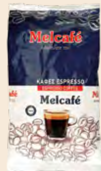
Καφές Αλεσμένος Espresso MELCAFE / Coffee Espresso MELCAFE