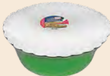
Σαλονικιός Αμύγδαλο / Salonikios Almond Λεκάνη / Bowl