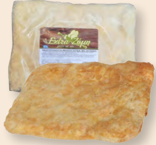
Μπουγάτσα Διπλή Συσκευασμένη / Bougatsa Packed