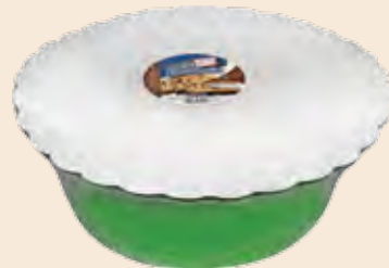
Σαλονικιός Κακάο / Salonikios Cocoa Λεκάνη / Bowl