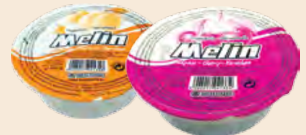
Τάπερ Πλαστικό MELIN / Plastic Pot MELIN Φράουλα, Κεράσι, Βερούκο, Ροδάκινο Strawberry, Cherry, Apricot, Peach