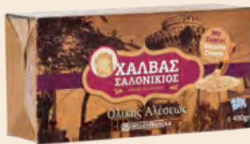
Σαλονικιός Ολικής Αλέσεως / Salonikios Wholegrain Κουτί / Box