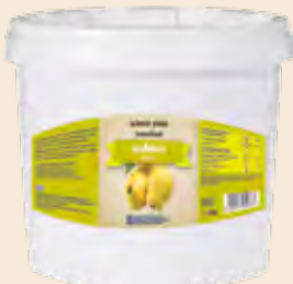
Κουβάς / Bucket Κυδώνι / Quince