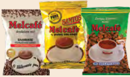
Καφές Ελληνικός Αλεσμένος MELCAFE / Greek Coffee MELCAFE Ασημί, Χρυσό, Πράσινο / Silver, Gold, Green