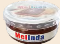
Βάζο Πλαστικό / Plastic Vase