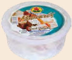
Διάφορες Γεύσεις / Mix Flavours Τάπερ / Plastic pot