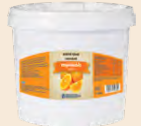
Κουβάς / Bucket Πορτοκάλι / Orange