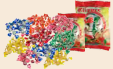
Clipper μπίλια ασορτί / Clipper candies mixed Ούζο, Μέντα, Φράουλα, Λεμόνι, Βύσσινο, Πορτοκάλι Ouzo, Mint, Strawberry, Lemon, Sour cherry, Orange