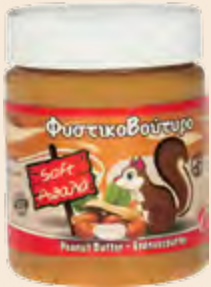
Φυστικοβούτυρο / Peanut Butter Βάζο Πλαστικό / Plastic Vase