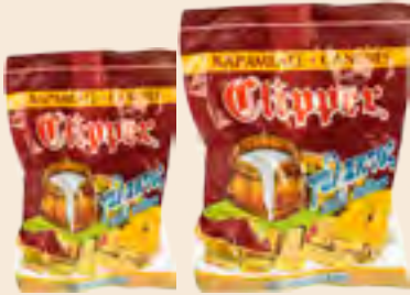
Clipper γάλακτος / Clipper milk toffees