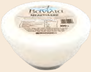
Βανίλια / Sweet Vanilla Μπολ Πλαστικό / Plastic Bowl