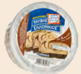
Σαλονικιός Κακάο / Salonikios Cocoa Στρογγυλλό Τάπερ Πλαστικό / Round Plastic Pot