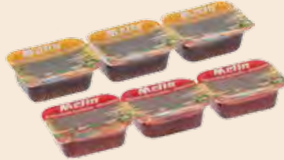
Μερίδα MELIN / Portion MELIN Φράουλα, Κεράσι, Ροδάκινο, Βερούκο, Πορτοκάλι Strawberry, Cherry, Peach, Apricot, Orange