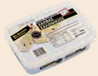
Σαλονικιός Φυστίκι / Salonikios Peanuts

Ορθογώνιο Τάπερ Πλαστικό / Rectangle Plastic Pot