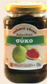
Γυάλινο Βάζο / Glass Jar Σύκο / Fig