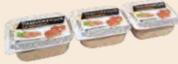
Ταχινόκρεμα / Sesame Cream Μερίδα / Portion