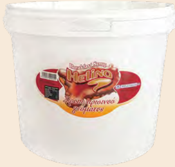
Σιρόπι με άρωμα μέλι / Sirup with honey flavour Κουβάς / Bucket