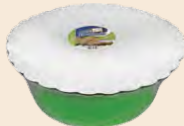
Σαλονικιός Φυστίκι Κελυφωτό / Salonikios Pistachio Λεκάνη / Bowl