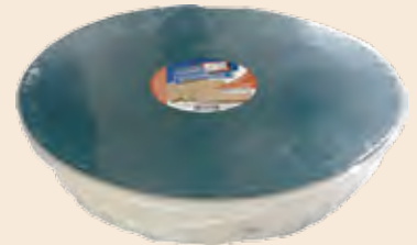
Σαλονικιός Αμύγδαλο / Salonikios Almond