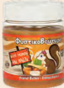
Φυστικοβούτυρο με Μέλι / Peanut Butter with Honey Βάζο Πλαστικό / Plastic Vase