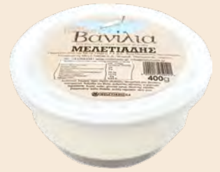
Βανίλια / Sweet Vanilla Τάπερ Πλαστικό με βάση / Plastic Pot with base