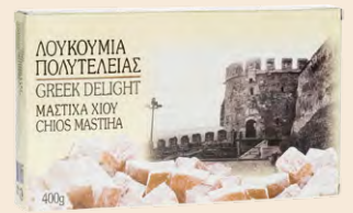
Μαστίχα Χίου / Chios Mastic Κουτί / Box