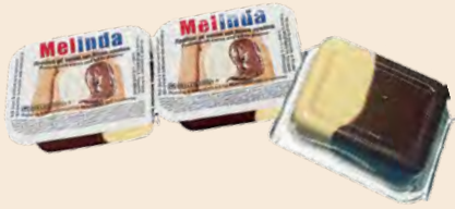
Μεριδα / Portion Πραλίνα με κακάο και λευκή πραλίνα Praline with cocoa and white praline