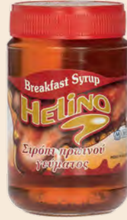
Σιρόπι με άρωμα μέλι / Sirup with honey flavour Γυάλινο Βάζο HELINO / Glass Jar HELINO