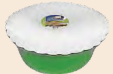
Σαλονικιός Φυστίκι / Salonikios Peanuts Λεκάνη / Bowl