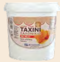
Ταχίνι με Μέλι / Sesame Cream with Honey Κουβαδάκι / Bucket