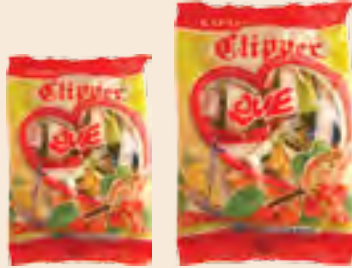
Clipper κρύσταλλο ασορτί / Clipper candies mixed Ούζο, Μέντα, Φράουλα, Λεμόνι, Πορτοκάλι Ouzo, Mint, Strawberry, Lemon, Orange