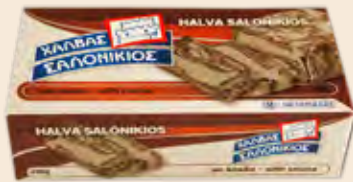
Σαλονικιός Κακάο / Salonikios Cocoa Κουτί / Box