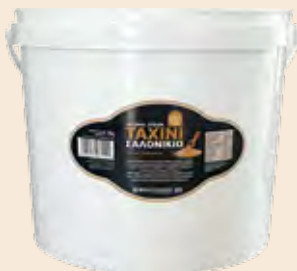
Ταχίνι / Sesame Cream Κουβάς / Bucket