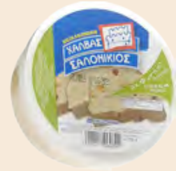
Σαλονικιός Φυστίκι Κελυφωτό / Salonikios Pistachio

Στρογγυλό Τάπερ Πλαστικό / Round Plastic Pot