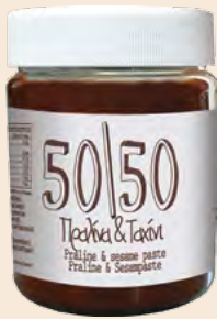
Βάζο Πλαστικό / Plastic Vase