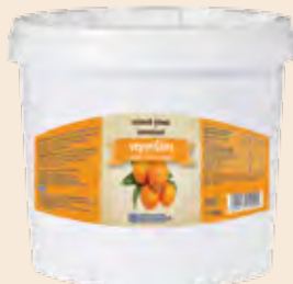
Κουβάς / Bucket Νεραντζάκι / Bitter Orange