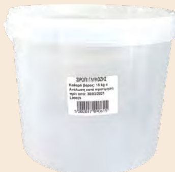
Σιρόπι γλυκόζης / Glucose sirup Κουβάς / Bucket