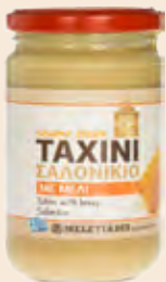
Ταχίνι με Μέλι / Sesame Cream with Honey Γυάλινο Βάζο / Glass Jar