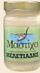
Μαστίχα Χίου / Chios Mastic Βάζο Γυάλινο / Glass Vase