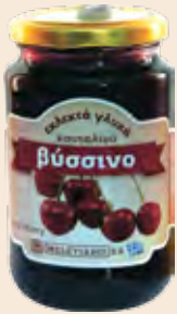
Γυάλινο Βάζο / Glass Jar Βύσσινο / Sour cherry