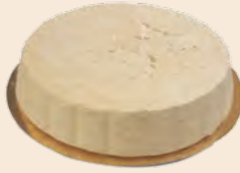
Σαλονικιός Βανίλια με κρέμα φυστικιού Salonikios Vanilla with peanut cream Ταψί / Pan