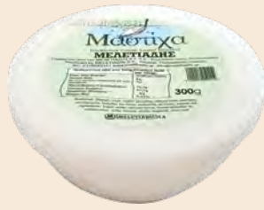
Μαστίχα Χίου / Chios Mastic Μπολ Πλαστικό / Plastic Bowl