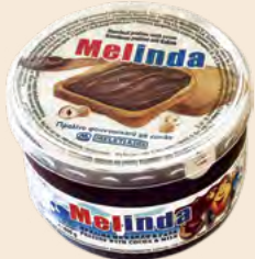
Βάζο Μηχανής / Plastic Pot