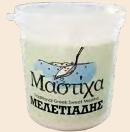
Μαστίχα Χίου / Chios Mastic Βάζο Πλαστικό / Plastic Vase