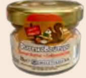
Φυστικοβούτυρο / Peanut Butter Μερίδα Γυάλινο Βάζο / Portion Glass Jar