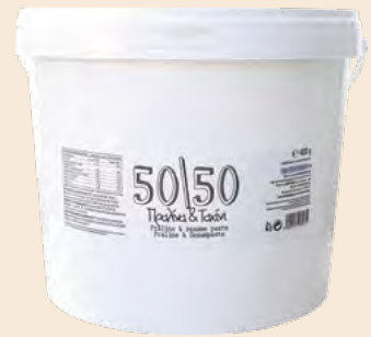
Κουβάς 4/ Bucket