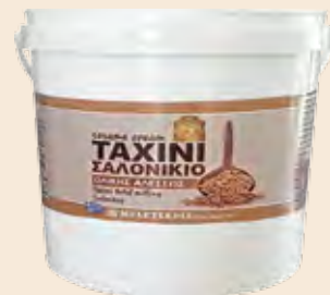
Ταχίνι Ολικής Αλέσεως / Sesame Cream Wholegrain Κουβάς / Bucket