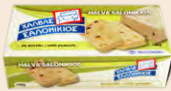
Σαλονικιός Φυστίκι / Salonikios Peanuts Κουτί / Box