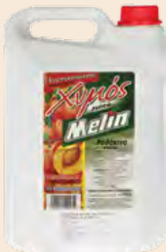
Συμπυκνωμένος Χυμός / Adiluted Juice Ροδάκινο / Peach