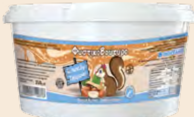
Φυστικοβούτυρο Crunchy / Peanut Butter Crunchy Κουβάς / Bucket