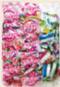
Clipper κρύσταλλο ασορτί / Clipper candies mixed Ούζο, Μέντα, Φράουλα, Λεμόνι, Πορτοκάλι Ouzo, Mint, Strawberry, Lemon, Orange