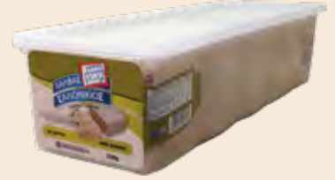
Σαλονικιός Βανίλια / Salonikios Vanilla Φόρμα πλαστική / Plastic Form