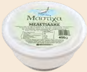
Μαστίχα Χίου / Chios Mastic Τάπερ Πλαστικό με βάση / Plastic Pot with base