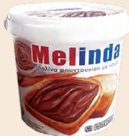
Κουβάς / Bucket