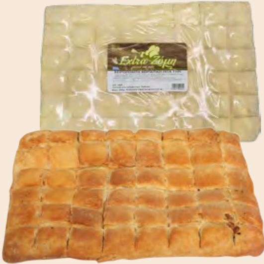
Χωριάτικη Ορθογώνια Πίτα Συσκευασμένη / Traditional Pie Rectangular Packed