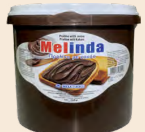
Κουβάς / Bucket