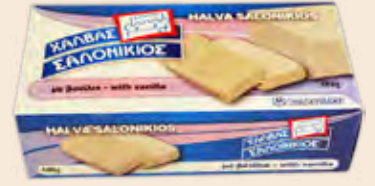
Σαλονικιός Βανίλια / Salonikios Vanilla