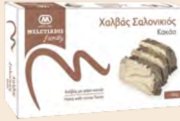
Family Κακάο / Family Cocoa