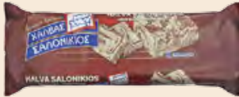
Σαλονικιός Κακάο / Salonikios Cocoa Πακέτο / Package