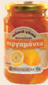
Γυάλινο Βάζο / Glass Jar Περγαμόντο / Bergamot