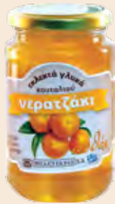
Γυάλινο Βάζο / Glass Jar Νεραντζάκι / Bitter Orange