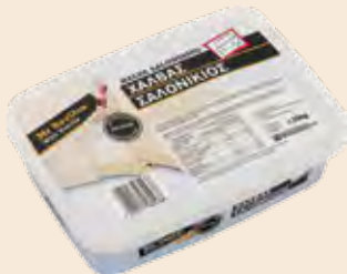
Σαλονικιός Βανίλια / Salonikios Vanilla

Ορθογώνιο Τάπερ Πλαστικό / Rectangle Plastic Pot