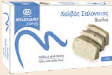
Family Βανίλια / Family Vanilla