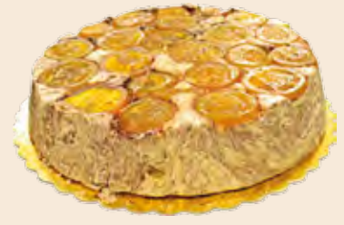
Σαλονικιός Κακάο Πορτοκαλί Extra Salonikios Cocoa Orange Extra Ταψί / Pan