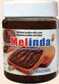
Βάζο Πλαστικό / Plastic Vase