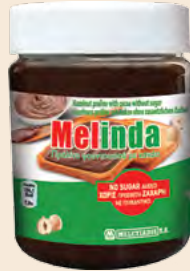
Βάζο Πλαστικό / Plastic Vase Πραλίνα χωρίς πρόσθετη Ζάχαρη Praline without added sugar