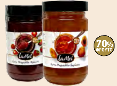
Γυάλινο Βάζο LA MEL / Glass Jar LA MEL Φράουλα, Κεράσι, Βερούκο, Ροδάκινο, Πορτοκάλι Strawberry, Cherry, Apricot, Peach, Orange