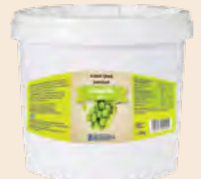
Κουβάς / Bucket Σταφύλι / Grape