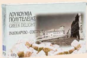
Ινδοκάρυδο / Coconut Κουτί / Box