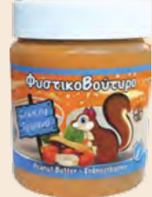
Φυστικοβούτυρο Crunchy / Peanut Butter Crunchy Βάζο Πλαστικό / Plastic Vase