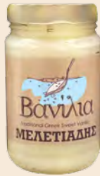
Βανίλια / Sweet Vanilla Βάζο Γυάλινο / Glass Vase