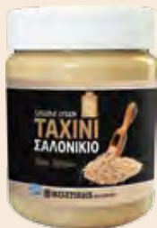
Ταχίνι / Sesame Cream Βάζο Πλαστικό / Plastic Vase