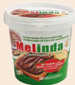
Κουβάς / Bucket Πραλίνα χωρίς πρόσθετη Ζάχαρη Praline without added sugar