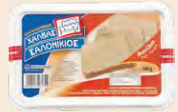
Σαλονικιός Βανίλια / Salonikios Vanilla

Ορθογώνιο Τάπερ Πλαστικό / Rectangle Plastic Pot