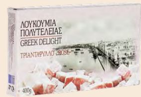
Τριαντάφυλλο / Rose Κουτί / Box