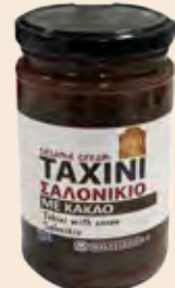
Ταχίνι με κακάο / Sesame Cream with Cocoa Γυάλινο Βάζο / Glass Jar