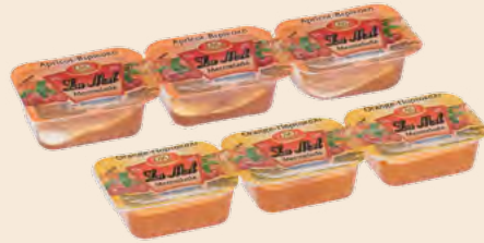
Μερίδα LA MEL / Portion LA MEL Βερύκοκο, Φράουλα, Ροδάκινο, Κεράσι, Πορτοκάλι Apricot, Strawberry, Peach, Cherry, Orange