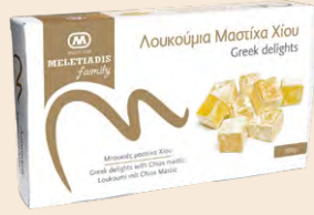
Μαστίχα Χίου / Chios Mastic Κουτί / Box