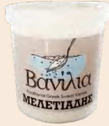
Βανίλια / Sweet Vanilla Βάζο Πλαστικό / Plastic Vase