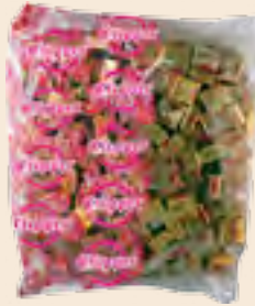
Clipper γάλακτος / Clipper milk toffees