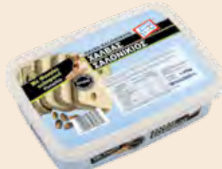
Σαλονικιός Φυστίκι Κελυφωτό / Salonikios Pistachio

Ορθογώνιο Τάπερ Πλαστικό / Rectangle Plastic Pot