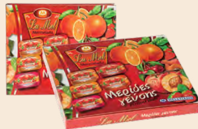
Διάφορες Γεύσεις LA MEL / Different Tastes LA MEL Φράουλα, Κεράσι, Βερύκοκο, Ροδάκινο, Πορτοκάλι Strawberry, Cherry, Apricot, Peach, Orange