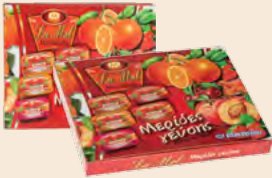
Διάφορες Γεύσεις LA MEL / Different Tastes LA MEL Φράουλα, Κεράσι, Βερούκο, Ροδάκινο, Πορτοκάλι Strawberry, Cherry, Apricot, Peach, Orange