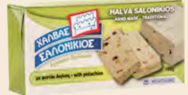
Σαλονικιός Φυστίκι Κελυφωτό / Salonikios Pistachio Κουτί / Box