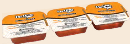
Σιρόπι με άρωμα μέλι / Sirup with honey flavour Μερίδα HELINO / Portion HELINO