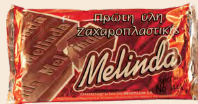
Απομίμηση Κουβερτούρας Νο444 Imitation of Couverture No444