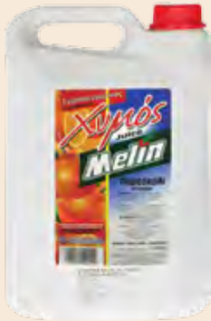
Συμπυκνωμένος Χυμός / Adiluted Juice Πορτοκάλι / Orange