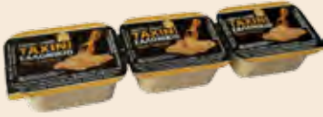
Ταχίνι / Sesame Cream Μερίδα / Portion