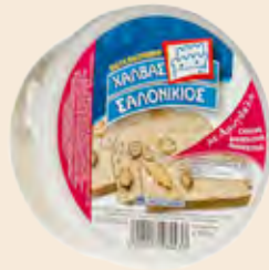
Σαλονικιός Αμύγδαλο / Salonikios Almond

Στρογγυλό Τάπερ Πλαστικό / Round Plastic Pot