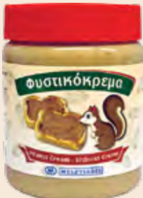
Φυστικόκρεμα / Peanut Cream Βάζο Πλαστικό / Plastic Vase