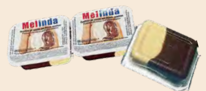
Πραλίνα / Praline Μερίδα / Portion