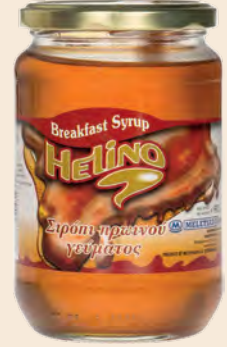
Σιρόπι με άρωμα μέλι / Sirup with honey flavour Γυάλινο Βάζο HELINO / Glass Jar HELINO