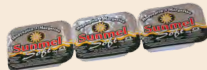
Μαργαρίνη Soft SUNMEL / Margarine Soft SUNMEL Μερίδα / Portion