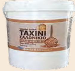
Ταχίνι Ολικής Αλέσεως / Sesame Cream Wholegrain Κουβάς / Bucket