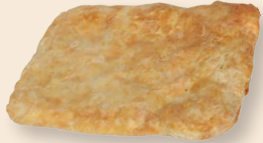
Μπουγάτσα Διπλή / Bougatsa