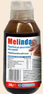
Μπουκάλι Squeeze / Squeeze Bottle