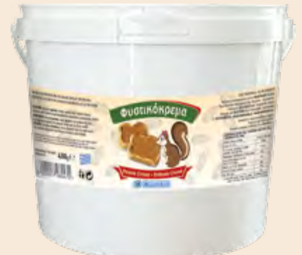
Φυστικόκρεμα / Peanut Cream Κουβάς / Bucket