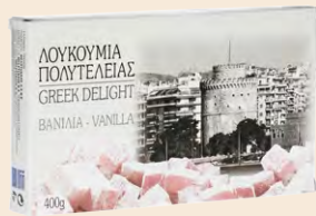
Βανίλια / Vanilla Κουτί / Box