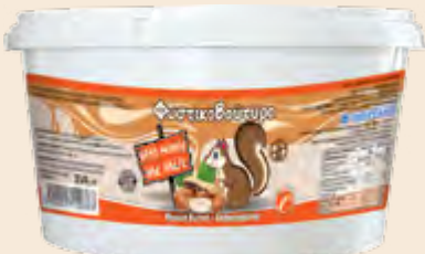
Φυστικοβούτυρο με Μέλι / Peanut Butter with Honey Κουβάς / Bucket